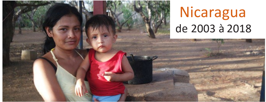
Nicaragua de 2003 à 2018