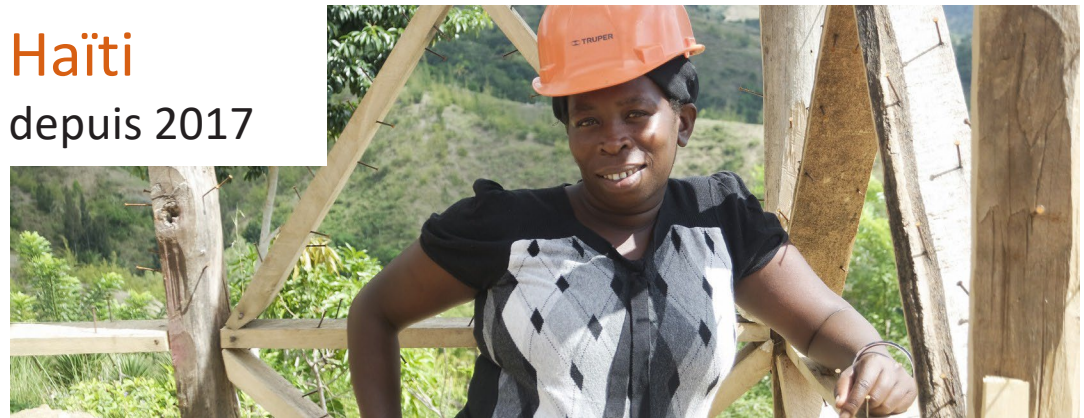
Haïti depuis 2017