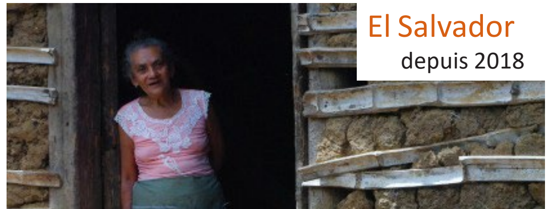
El Salvador depuis 2018